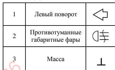
Рис.2. Схема подключения электрооборудования